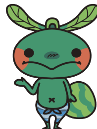
国東市マスコットキャラクター 「さ吉くん」